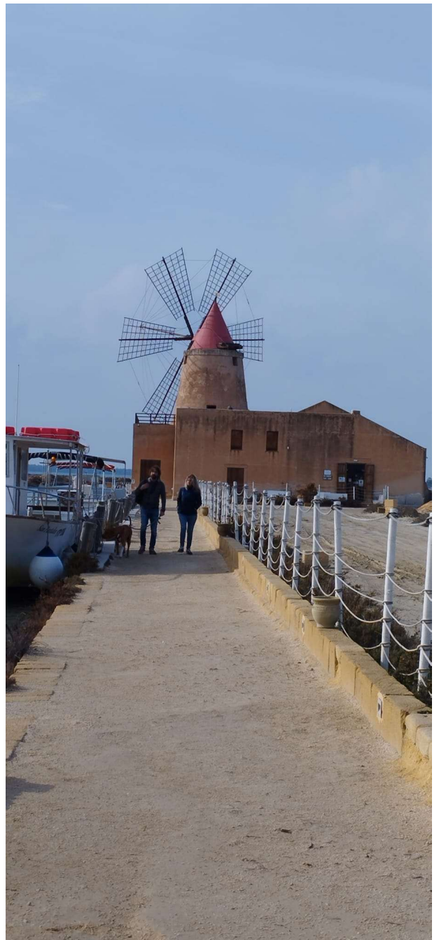
E dal nostro amico Teobaldo