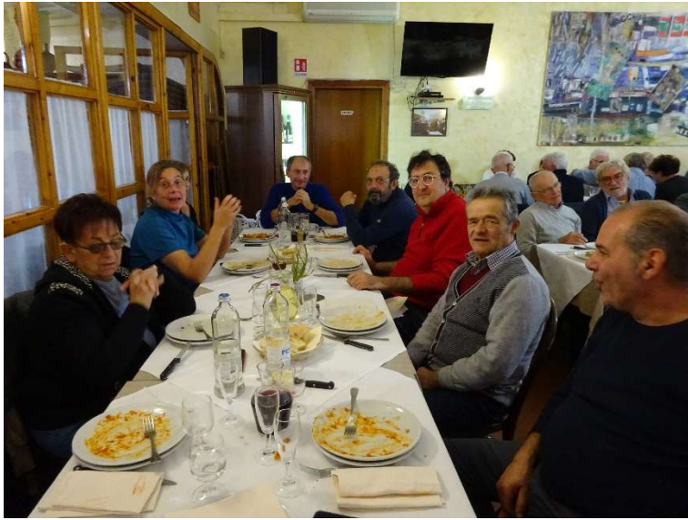
Foto del pranzo degli auguri