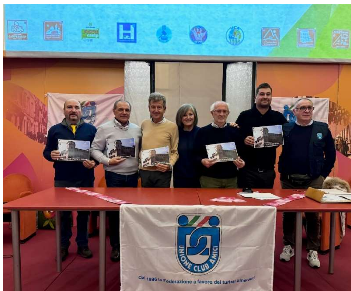
Foto dell'assemblea UCA di Jesi